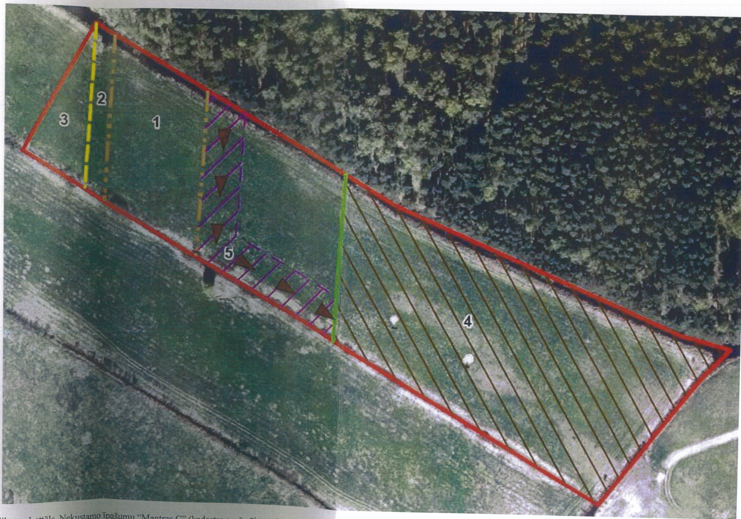
A daļas 1.pielikuma 1 attēls. Nekustamo īpašumu "Mantras C" (kadastra apzīmējums 80700083519) un "Mantras P" (kadastra apzīmējums 80700083520) robežu plāns no atsavināmajiem zemes gabaliem izraktās kūdras novietošanai atlikušās zemes vienības daļā - teritorijā nr.5.